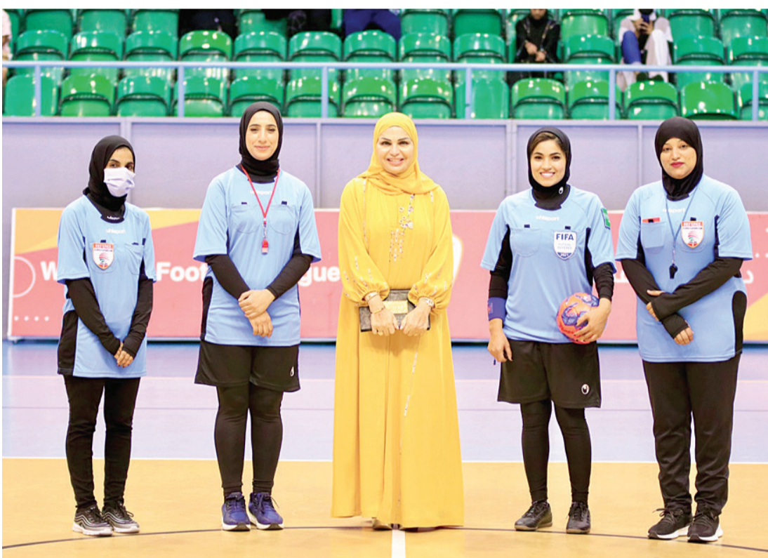
طاقم تحكيم نسائي في المباريات

وتقام يوم الجمعة المقبلة منافسات الجولة الثانية من الدوري وذلك بإقامة ٧ لقاءات، حيث سيجتمع اللقاء الأول نادي عمان ومسقط على صالة مجمع السلطان قابوس الرياضي ببوشر، بينما سيجتمع اللقاء الثاني السويق والسب على صالة مجمع السلطان قابوس الرياضي ببوشر، وفي اللقاء الثالث يتنافس فريقاً صحار وصحم على صالة مجمع السلطان قابوس، وفي اللقاء الرابع يلتقي النهضة وعبري على صالة نادي ينقل، بينما يلعب في اللقاء الخامس نادياً صلالة ووظفار على صالة استاد السعادة الرياضي، وفي اللقاء السادس يتواجه نادياً بهلا والبشائر على صالة نادي الأمل الرياضي، بينما تختتم لقاءات الجولة الثانية من الدوري بإقامة المباراة السابعة بين نادي الاتفاق والطليعة بصالة نادي الأمل الرياضي، وستقام جميع المباريات في تمام الساعة العاشرة والحادية عشرة صباحاً.