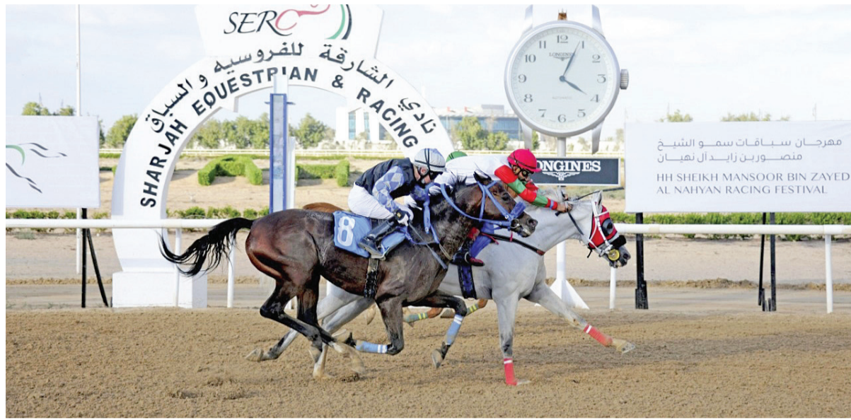
الحصان المستفز يحسم لقب كأس مجلس التعاون