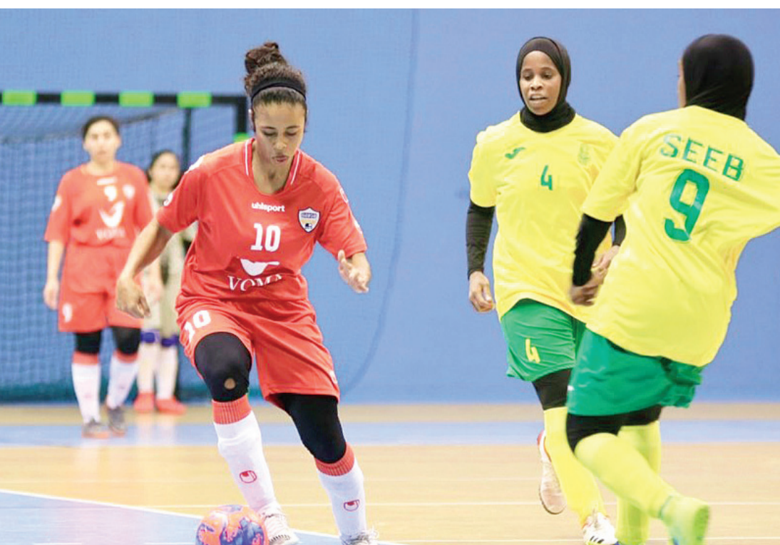
من لقاء نادي عمان والسبب في الجولة الأولى

التقدم بهدفين مقابل صفر للطليعة، وبدأ الشوط الثاني بحافز كبير ورغبة من نادي الطليعة لتعديل النتيجة، حيث استطاع تسجيل أول أهدافه في المباراة ولكن سرعان ما عاد نادي البشائر إلى خطوطه الدفاعية والهجومية التي من خلالها استطاع إنهاء المباراة لصالحه بنتيجة ٤ / ١. وفي المباراة الثانية تواجه فريقاً الاتفاق وبهلا، حيث استطاعت لاعبات بهلا التآلق بشكل كبير في الأداء الفني ومهارة الاستحواذ على الكرة والتحكم والسيطرة في خطى الهجوم والدفاع والذي لم يمنح نظيره الاتفاق أي فرصة للاستحواذ على الكرة ليتمكن نادي بهلا من الفوز بالمباراة بنتيجة ٧ / صفر.