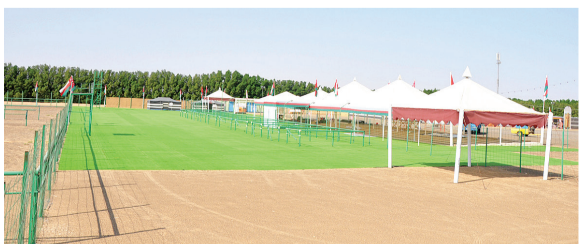
جاهزية موقع إقامة مهرجان المزاينة