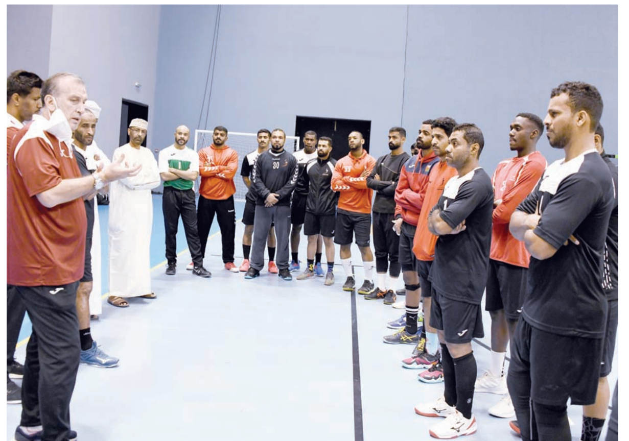
من تدريبات المنتخب الوطني لكرة اليد