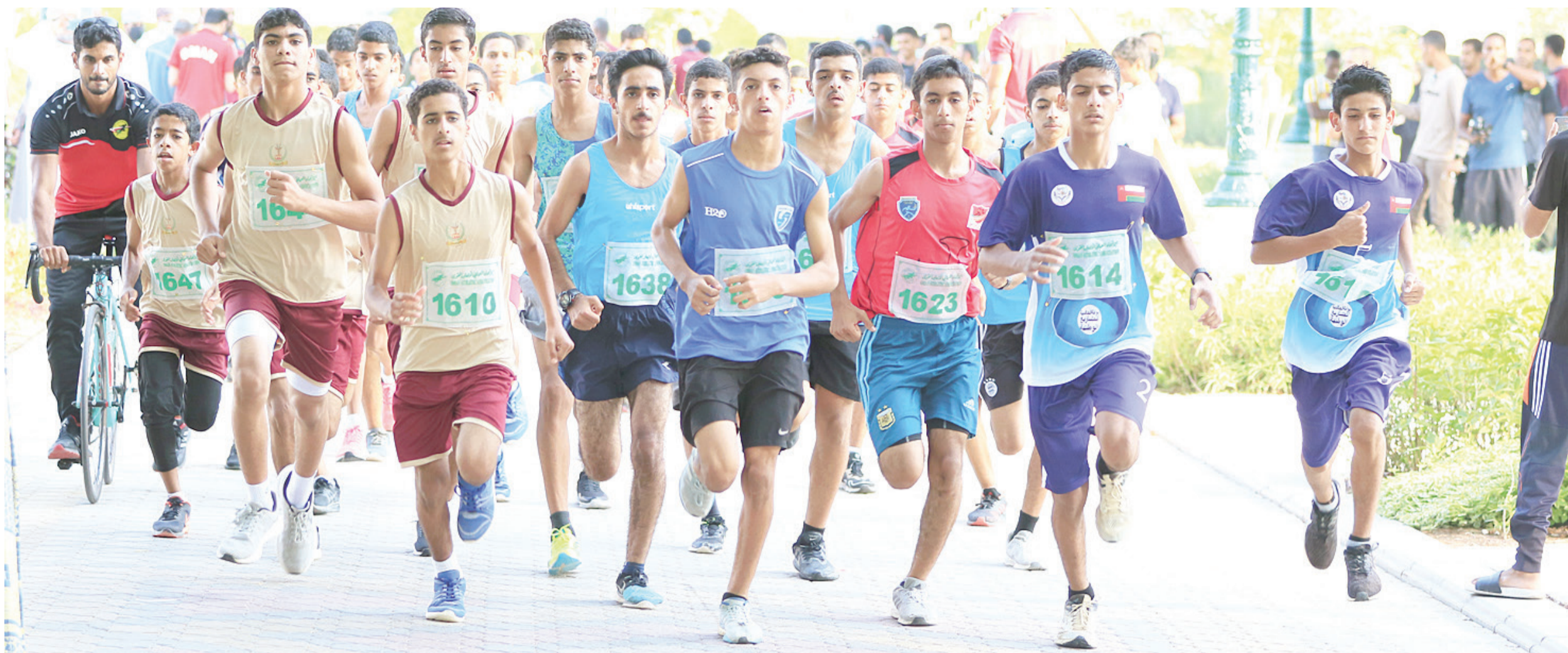
من انطلاق سباق فئة الناشئين