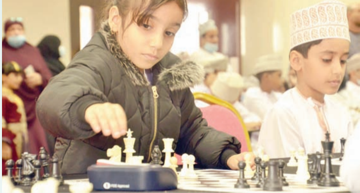
جانب من منافسات بطولة الشطرنج المدرسي للناشئين