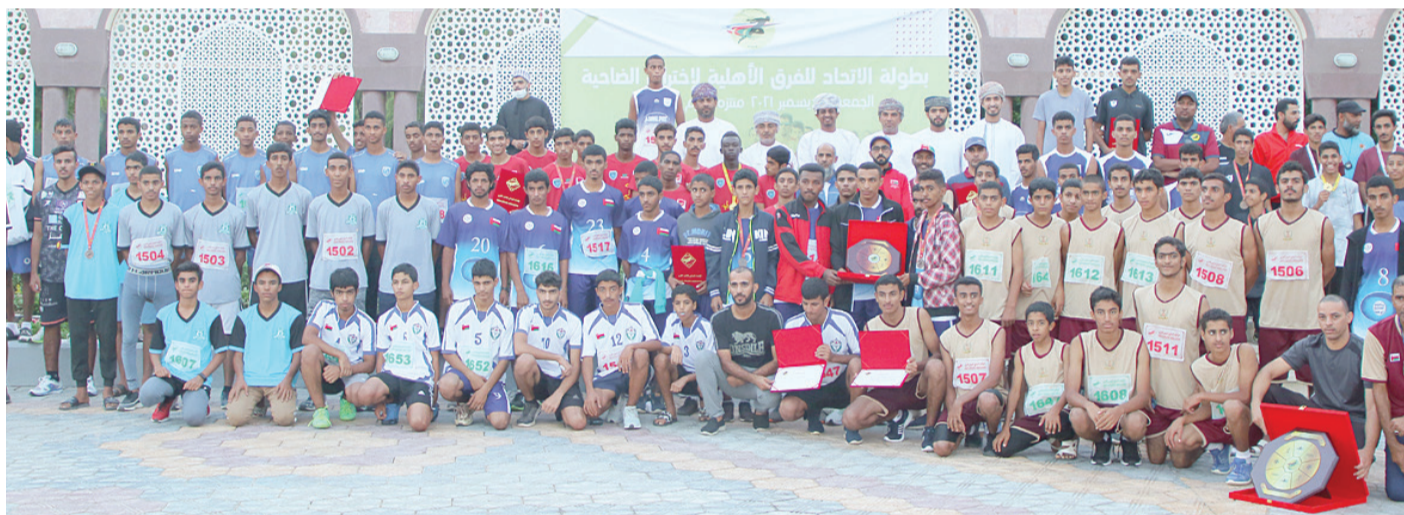
لقطة جماعية للمشاركين في الختام

وفي شهر أبريل ستقام فعالية واحدة وهي البطولة الجديدة والتي أسيدها الاتحاد العماني لألعاب القوى وهي بطولة الماسترز (فوق ٤٠ سنة) والتي ستقام بمحافظة مسقط، بينما في شهر مايو المقبل، ستبدأ الفعاليات بإقامة ملتقى التحدي المفتوح الخامس لسباقات الجري والوثب والرمي للذكور والإناث والذي سيقام بولاية صحار بمحافظة شمال الباطنة، وتعبه إقامة سباق الدقم والذي سيقام بولاية الدقم بمحافظة الوسطى. على أن تتوقف البطولات في شهر يونيو بسبب ارتفاع حرارة الصيف، لتعود إشارة البطولات بإقامة سباق المزيونة في شهر يوليو القادم والذي سيقام بولاية المزيونة بمحافظة ظفار، وسيكون ختام روزنامة الموسم الرياضي ٢٠٢١ - ٢٠٢٢ بإقامة بطولة خريف صلالة لاختراق الضاحية بمحافظة ظفار في شهر أغسطس المقبل. على أن ينطلق الموسم الرياضي ٢٠٢٢ بإقامة سباق صور وذلك في شهر نوفمبر المقبل، وسيقام السباق بولاية صور بمحافظة جنوب الشرقية، وفي نفس الشهر ستقام بطولة الضيبي لاختراق الضاحية، تصفيات درع الوزارة لأندية محافظات مسقط والداخلية والظاهرة وجنوب