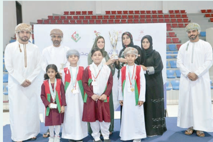
تتويج مدرسة مشارق الأنوار بلقب البطولة

من المهارات العلمية فهي لعبة تعتمد على الذكاء والتركيز والصبر والشجاعة الذهنية واتخاذ القرارات وهي علم واسع ونشأ في العصور القديمة، وتطور عبر السنوات لتصل إلى ما وصلت إليه. وأشارت قائلة: لقد أسهم اهتمام وزارة التربية والتعليم ممثلة بالاتحاد العماني للرياضة المدرسية بالتعاون مع اللجنة العمانية للشطرنج والشركاء من القطاع الخاص في الارتقاء بمستوى الطلبة المحبين للعبة من خلال تنظيم المسابقات والبطولات والمسكرات والعمل على نشر اللعبة والارتقاء بمستواها الفني، مؤكداً أن مثل هذه المسابقات تمنح الفرصة لأبنائنا الطلبة والمطالبيات لإظهار شغفهم وإمكاناتهم ومهاراتهم المختلفة التي تجعلهم أكثر إبداعاً وتطوراً. وهنأت البوسعيدية اللامعين واللاعبات اللامعيات اللامعيات في المرحلة النهائية من ٤٧ لاعبا ولاعبة تأهلوا من ١١ محافظة تعليمية، بالإضافة إلى مديرية المدارس الخاصة، مؤكداً استمرار مؤسسة الزبير لتعزيز هذا التعاون مع اللجنة العمانية للشطرنج خلال الفترة المقبلة وبما يتواءم مع خططها لنشر اللعبة وزيادة رقعها معماريسيا.