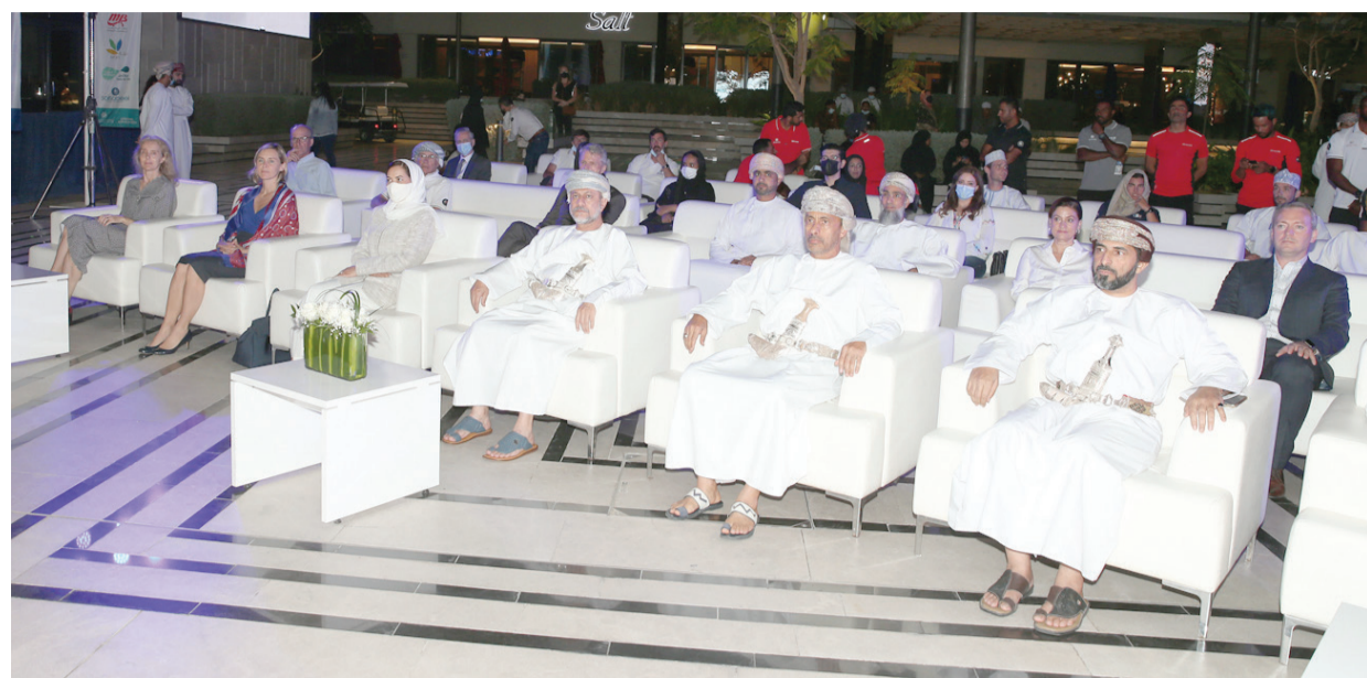
الحضور الرسمي في حفل الختام