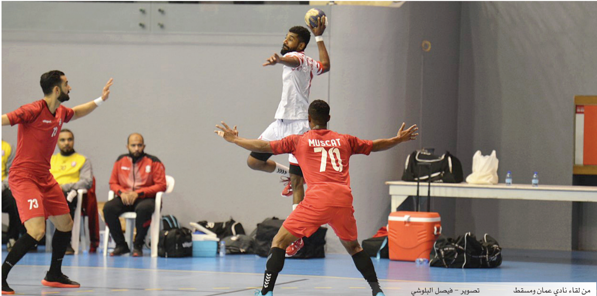
من لقاء نادي عمان ومسقط