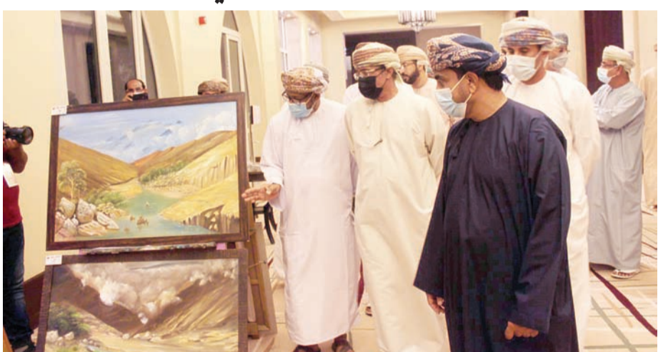
جانب من افتتاح معرض الفنون التشكيلية