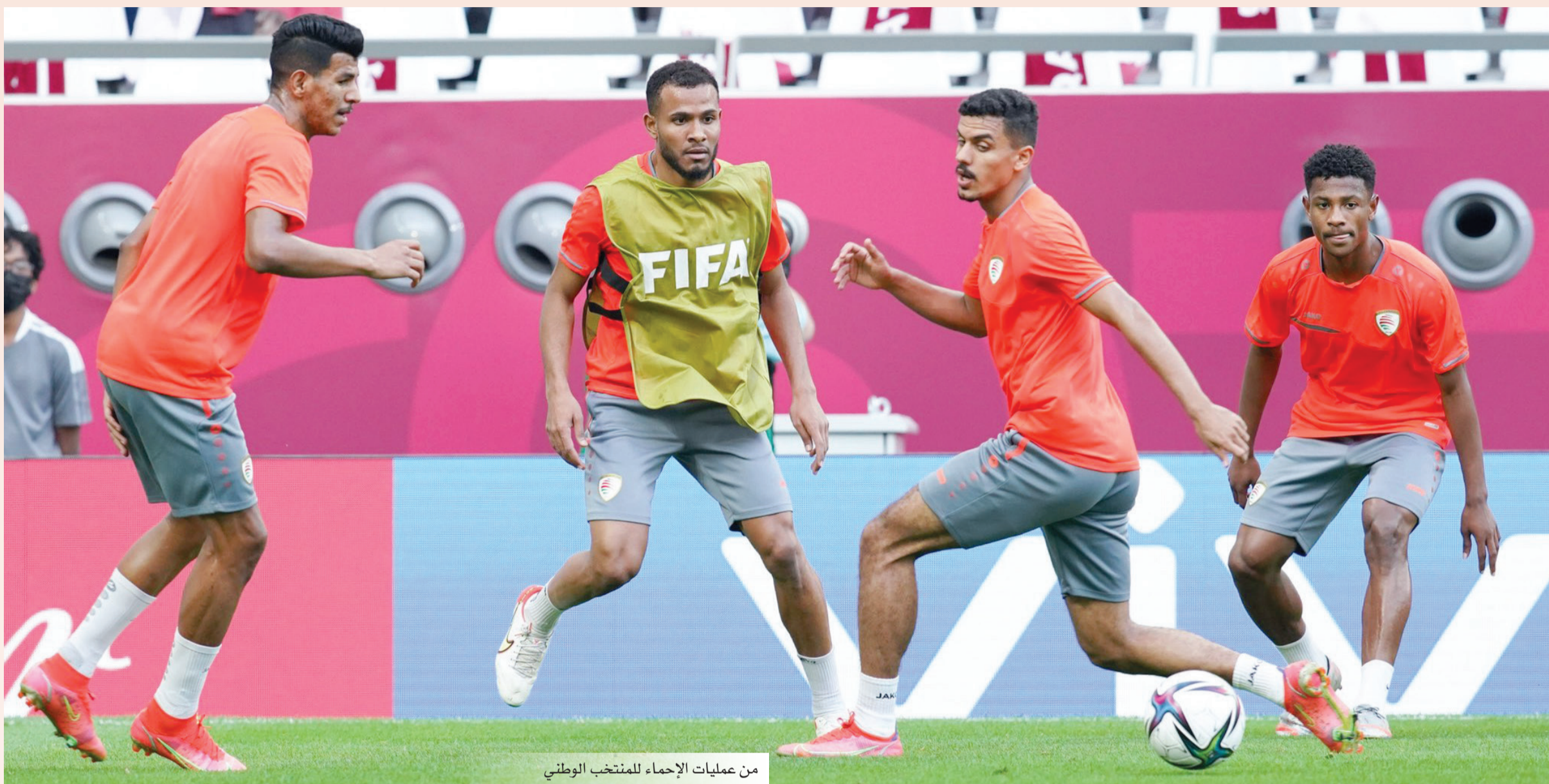
من عمليات الإحماء لمنتخب الوطني

الأولى، وأصبحت الاحتمالات واردة في تأهل منتخبنا الوطني والمنتخب البحريني أو المنتخب العراقي ولكن لكل منتخب حساباته الخاصة، منتخبنا يجب أن يفوز على منتخب البحرين ويتعادل أو يفوز منتخب قطر على منتخب العراق، والاحتمال الثاني هو تعادل منتخبنا الوطني أمام منتخب البحرين وفوز منتخب قطر على العراق ببارق هدفين أو أكثر، أما الاحتمال الثالث هو تعادل منتخبنا أمام منتخب البحرين وفوز قطر على العراق ببارق هدف وحيد وهنا سيكون منتخبنا ومنتخب العراق (-١) من الأهداف.