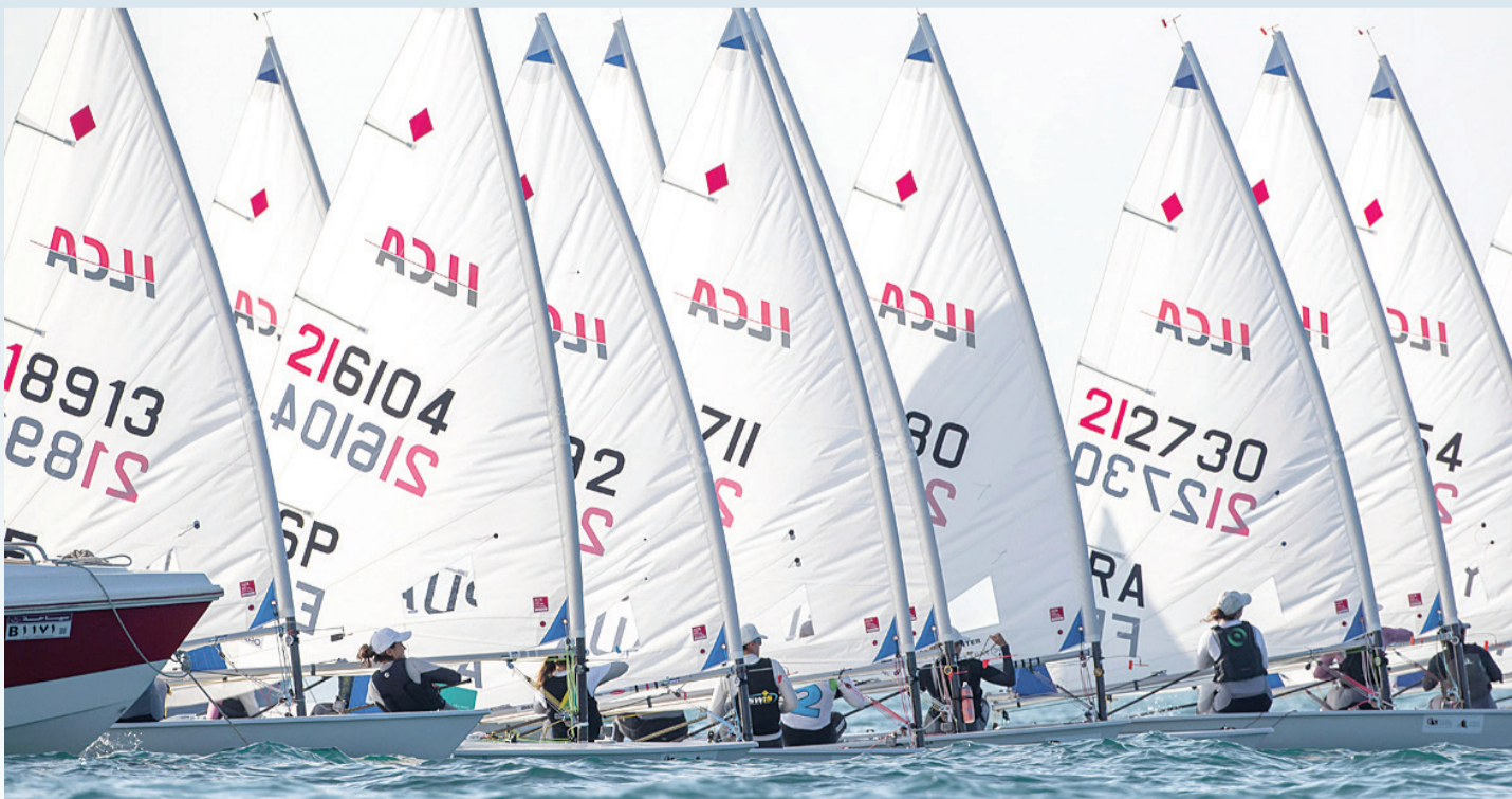
جانب من منافسات اليوم الرابع لسباقات بطولة العالم لقوارب الرادياتل بالمصنعة

وتحظى بطولة العالم لقوارب الرادياتل ٢٠٢١ بدعم من شركة الطيران العماني وشركة أوكيو ومنتجج باريسيلو المصنعة كراعاً رسميين، إضافة لدعم كل من شركة بيئة وشركة سبيليس للمياه المعدنية وشركة مزون للألبان وجمعية البيئة العمانية والإسناد الطبي من المجتمع الطبي البحري بقاعدة سعيد بن سلطان البحرية لتغطية الطبية خلال أحداث هذه السباقات.