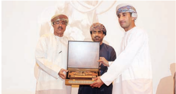
تكريم والي الدقم

وفي دورة البياطرة لالتقاط الأوتاد التي شارك بها ١٠ مشاركين ركزت على صحة وسلامة الخيول وكيفية إجراء الفحوصات الأولية للخيول قبل المشاركة في أي سباق مع تدخل في إبعاد الخيل للصابة التي يراها الأطباء البيطريون غير قادرة على المشاركة في السباق لأي ظرف صحي كان حتى لا تتضاعف معها الإصابة أو المرض. ونظراً لتنامي وانتشار هذه الرياضة في مختلف دول العالم فإن الهدف من هذه الدورات الثلاث إدارة وتنظيم البطولات التي تقام في دول المشاركين مع إيجاد الرغبة من البعض منهم في التأهل إلى مستوى المحاضرين بالمستقبل.