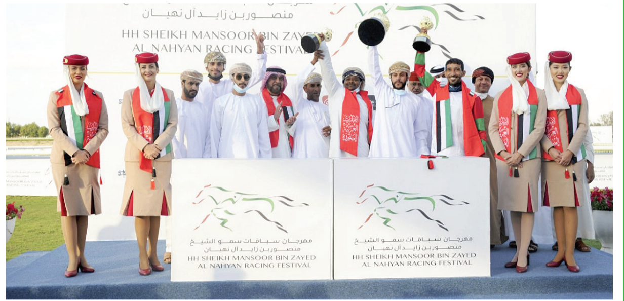
تتويج الحصان المستفز بالمركز الأول