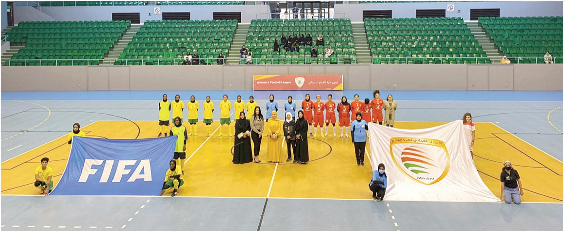
جانب من مراسم حفل افتتاح الدوري النسائي

أرجاء صالة المباريات، والتزمت جميع الفرق باللعب النظيف واحترام الفريق الخصم، وبدأت لاعبات الفرق المشاركة مباريات الجولة الأولى بعزيمة وإصرار أكبر لضمان نقاط المباراة الأولى، كما قامت الفرق المشاركة بالدوري بالاستعداد الجيد للجولة الأولى خلال الفترة الماضية.