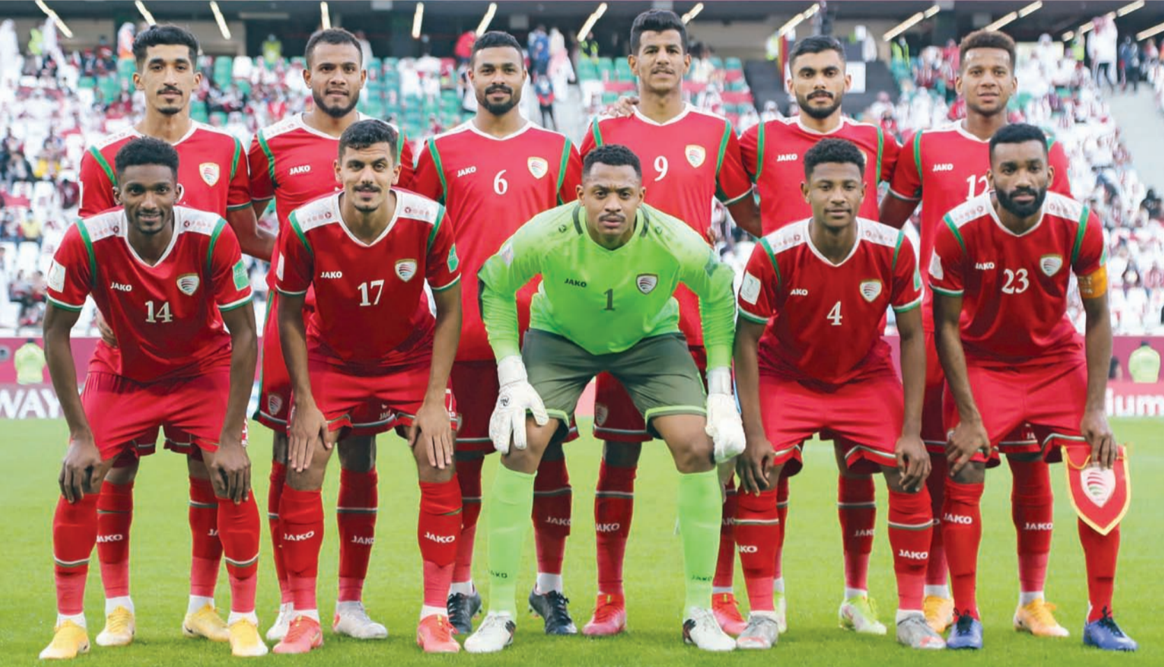
المنتخب الوطني الأول

قدم الاتحاد العماني لكرة القدم خطاباً رسمياً إلى الاتحاد الدولي للفيفا على إثر الأخطاء التحكيمية التي شهدتها مباراة المنتخب الوطني الأول أمام نظيره القطري ضمن بطولة كأس العرب المقامة في الدوحة والتي أشرت على النتيجة النهائية للمباراة، وحدد الاتحاد العماني لكرة القدم في خطابه تلك الأخطاء الواضحة ومنها: احتساب ركلة جزاء في غير محلها واحتساب هدف شابه الكثير من عدم الوضوح دون الرجوع إلى تقنية «الفار» بصرى النظر عن عدم احتساب الحكم للأخطاء المتكررة والتدخلات القوية التي تعرّض لها لاعبو المنتخب في أكثر من مناسبة خلال المباراة.